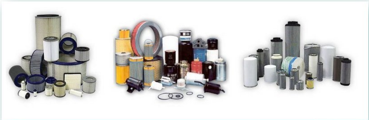
Filtr hydrauliczny zam. HF28833