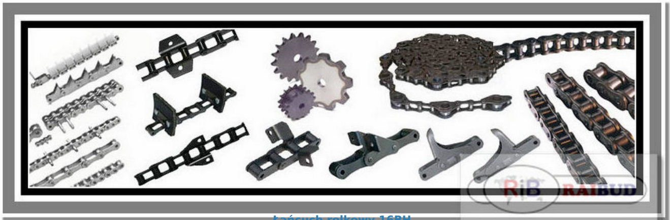
Łańcuch rolkowy 16BH