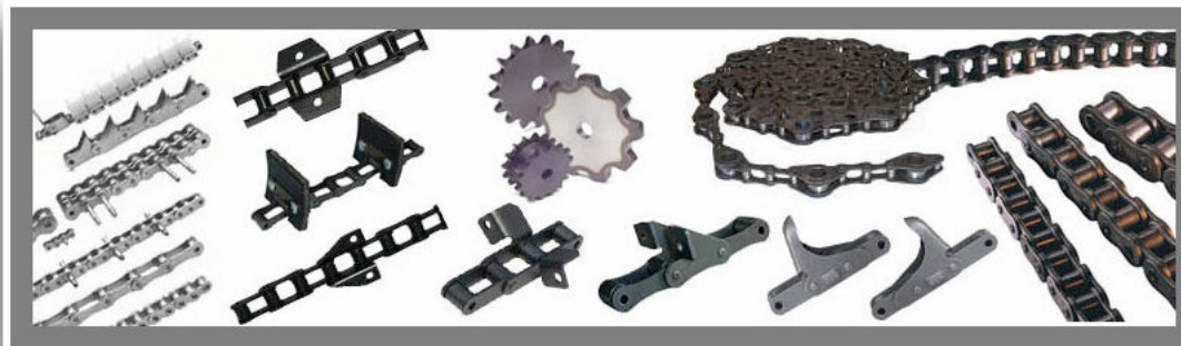
Łańcuch sieczkarnia Claas Jaguar 10m. 940860.3 rolka 10m. WZMACNIANY S55V